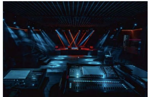
Visión desde control