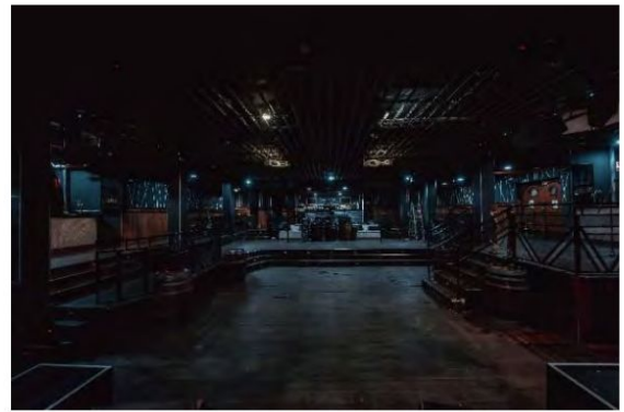
Visión desde escenario sin luz